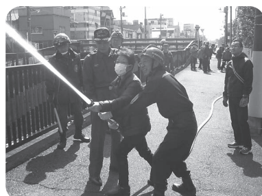
東自治会による「おしかけ防災訓練」の様子

消火隊に興味のある方は、久が原特別出張所にお名前、住所、連絡先をお知らせください。後日、各自治会担当者から連絡させていただきます。消火活動訓練を見学したい方は、毎月(12月)