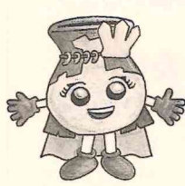
イセクイーン 130周年記念