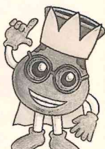
イセキング 120周年記念