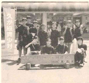
4年ぶりの宿泊研修 白浜少年自然の家 令和5年8月