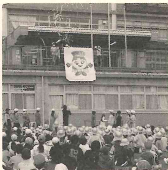
イセクイーンのお披露目