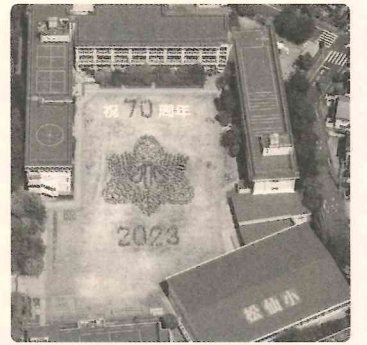
児童の人文字で校章