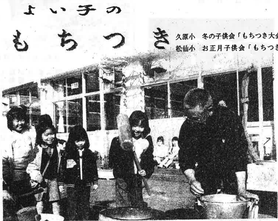
よい子のもちつき 久原小 冬の子供会「もちつき大会」 松仙小 お正月子供会「もちつき」

年の瀬になると、街や家々から響いてきたもちつき音。今では、全く聞かれなくなり、行事の一つとして復活させ、子供達に体験させたいとの地域の人の願いが振興し、PTAと協賛で実現しました。以来、十数年前のことです。