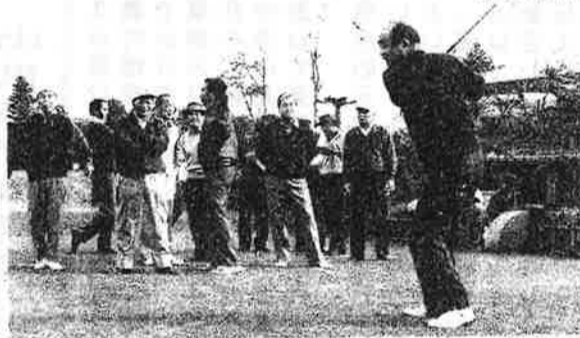
今日の調子はどうかな？

回を重ねて平成二年十一月で、第百三十五回を迎えた「みどり会」ゴルフコンペを千葉県の市原市、八幡ゴルフ場で行いました。現在の会員数は三十五名を数えるまでになりました。遊びの会としては非常に長く続いております。商店会の先輩とゴルフをすることで、コミュニケーションができて、信頼が生まれ体づくりが出来て愉快になります。