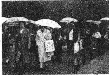
西自治会の皆さん

西自治会婦人部では、春秋バス旅行を実施しています。十一月二十九日は季節外れの台風の影響で雨の中出発。東京都葛西臨海水族園では、マグロが群泳する大水槽や、世界七つの海の魚達がとりどりに色鮮やかに舞い泳ぐ様に、感嘆の声しきりでした。江戸の昔から庶民の憩いの場である浅草では、昼食に舌鼓をうち観音様に参詣、雨にけぶる墨田川くだりの水上バスに乗船、かつての無残な汚染から浄化もすすみ、両岸には江戸情緒を今も残している歴史やエピソードを持つ、橋々をくぐり、浜離宮に到着。広大な園内に、將軍家の鷹狩りの場であった往時の面影をしのびつつ散策、雨中ながら楽しい一日を過ごしました。