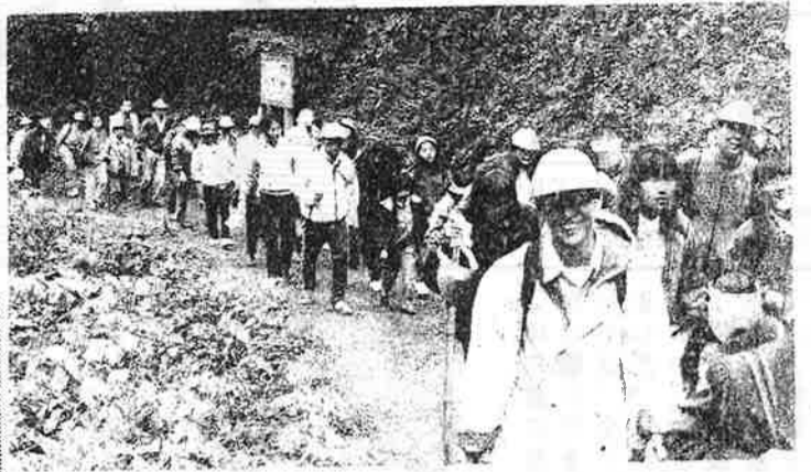
さあ、もうすぐ頂上だ

秋晴れの十一月二十五日、青少年対策久が原地区委員会主催によるハイキングが行われました。四歳から七十五歳まで総勢七十五名が朝七時三十分、久が原駅前集合、「高尾山」に向かいました。今秋は、暖かい日が多く、紅葉が遅れているようですが、それでも終着駅の「高尾山口駅」付近では、ウルシやカエデに秋の色が少しづつ加わって来ました。さあ、これからハイキングの始まりです。山頂までは約二時間の道のりです。最初はなだらかな道も、次第に険しくなり、参加者の額には汗がにじんできました。あたりは次第に紅葉の色を増し、秋を十分感じさせてくれました。十二時を少し過ぎた頃、山頂に着きました。そこには、たぐさんのハイカーが、お弁当を広げていました。やっとの思いで場所を探しめいめい手作りのお弁当が舌鼓。この味がまた格別です。一同大満足し、帰路に一人の事故もなく、無事ハイキングを終えることが出来ました。