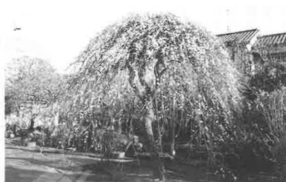
にある、樹齢九十年とも言われる枝垂れ梅です。高さは4m30cm、東西5m・南北に4mの幅で広がっています。その見事な枝ぶりは、ご近所で評判になっています。写真は昨年のもですが、間もなく、わがまちに華麗な姿が見られることでしょう。