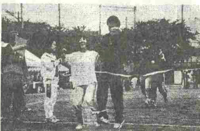
一等賞でゴールイン!