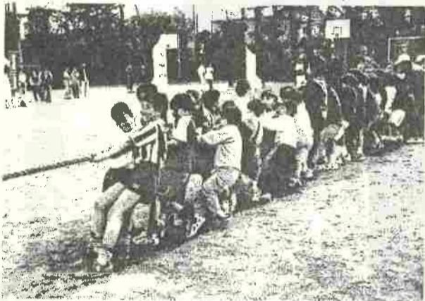
参加者全員で大綱引き

平成11年10月31日の日曜日に 第七回鵜の木地区連合運動会が大森第 七中学校にて盛大に開催されました。 天候にも恵まれ鵜の木地区7町会が協 力して準備したこの運動会に約800 人もの方が集まり、おこなもことも 楽しい一日を過ごしました。