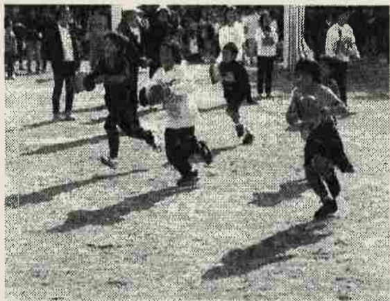
風船運びゲーム ゴールまで、みんなガンバレ！

第十回 鵜の木地区連合運動会が 盛大に開催されます。この機会に、 各町会、各団体の皆様、ご協力 をお願いします。また、ご来場 ください。お待ちしております。 （千鳥北町会長）