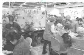
もみじふれあい元気塾♪ フラワーアレンジメントです