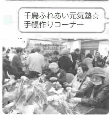
千鳥ふれあい元気塾☆ 手帳作りコーナー