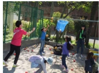
「ガーデンパーティー」 ゲームコーナー