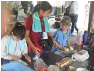
「子ども夏のつどい」1日目 カレー作り