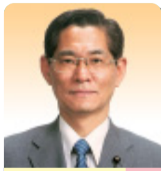
溝口 誠 公明