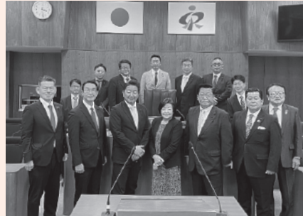
東松島市議会議場にて