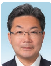
副議長 田村 英樹