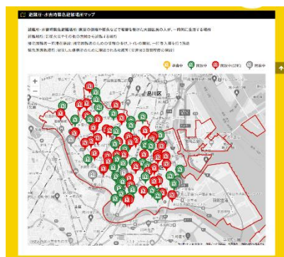
防災ポータルの様子