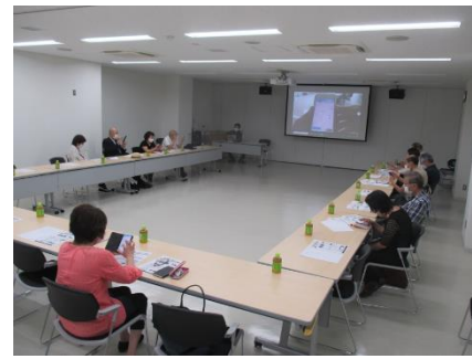
区民へのアプリ操作説明 (田園調布特別出張所)