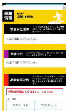
防災アプリの様子