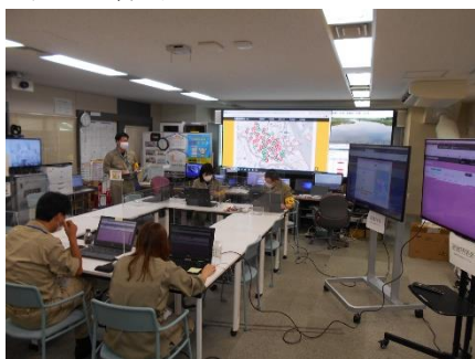
情報発信作業 (防災危機管理課)