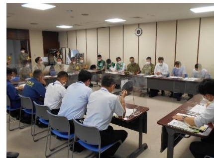
関係機関との意見交換会