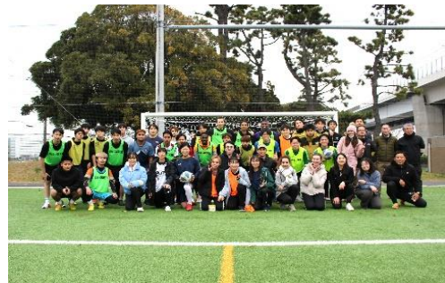
「Ota スポーツで国際交流」当日の様子