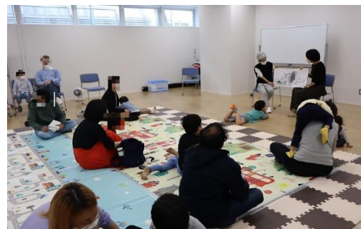
「絵本 de 国際交流」当日の様子