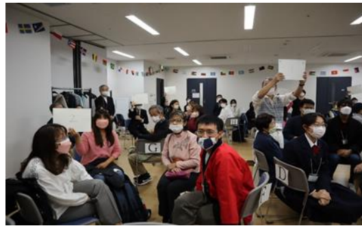
「日本語でスピーチ 2022」当日の様子