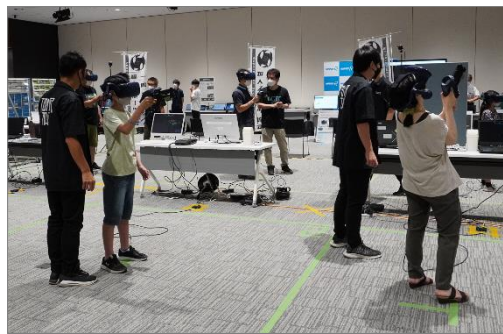
(2) VR スポーツ（TOWER TAG）