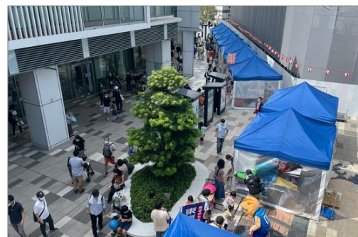
(4) 地域周遊マルシェ