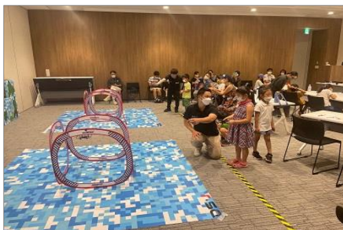
(3) HANEDA STEAM LAB（ドローン体験）