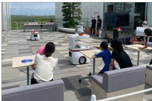
(1) スマートシティ体験（ロボット）