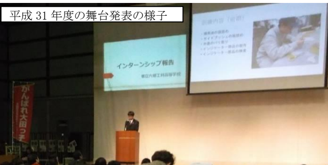
平成31年度の舞台発表の様子