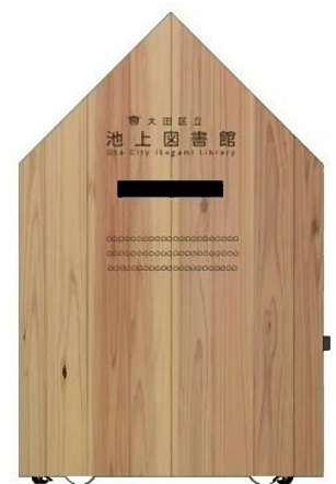
▲えきもくの活用（図書返却ポスト）