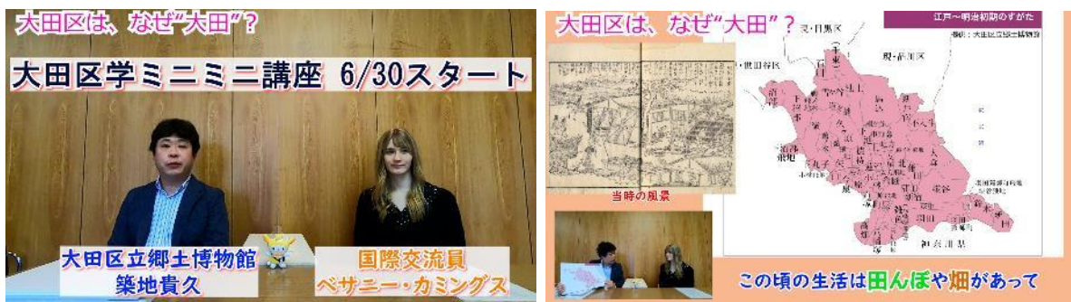
ミニミニ講座のイメージ