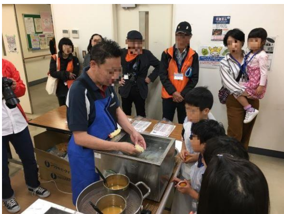
矢口特別出張所での食品サンプル製作体験