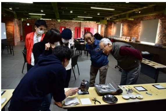
アート工房での錫のブローチづくり体験