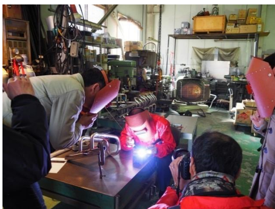
モノづくり工場見学の様子