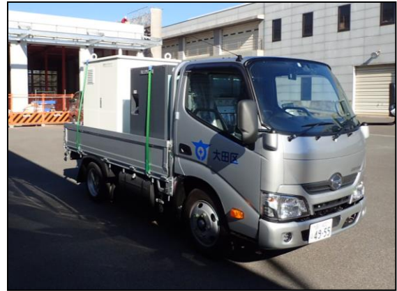
排水ポンプ車全景（正面）