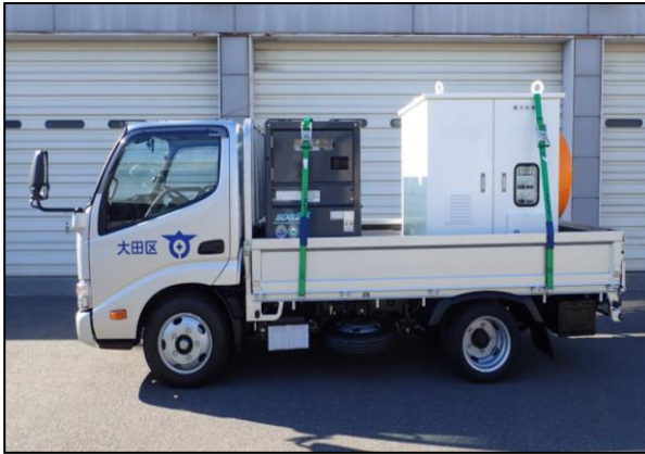
排水ポンプ車全景（側面）