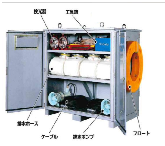
ポンプ・ホース等収納 (イメージ写真)