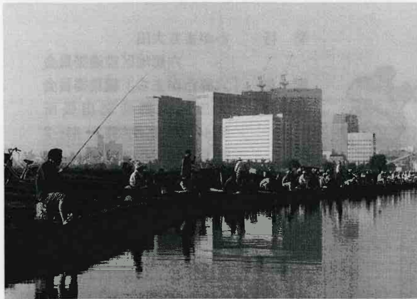
日の出もない多摩川の釣り人たち(第7回いきいき大田写真コンクール入選・美農利雄氏撮影)釣りファンのなんと多いことか!