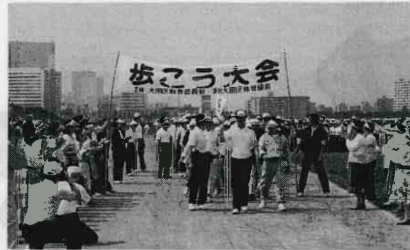
春と秋の歩こう大会・主催=大田区体育協会。

それから車利用の場合は、住宅地の道路などに迷惑駐車しないように。また犬の野放しやフンの放置にも注意しましょう。