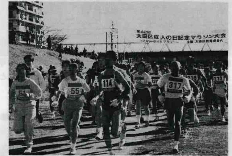
1月第2日曜日、新しい人生のスタートを切る！ 成人 の日記念マラソン大会。主催=大田区教育委員会。