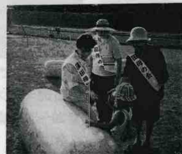
夏休みの水辺パトロール