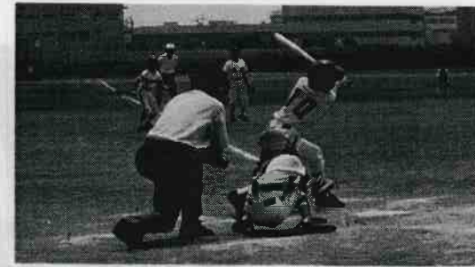
毎年8月、若き血燃ゆる少年野球大会が六郷橋緑地のグラウンドで。女子ソフトボール大会も同時開催。主催=青少年対策六郷地区委員会。