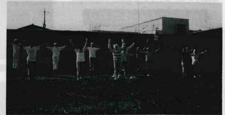
寒い冬の朝でも元気いっぱいラジオ体操。西六郷有志は 昭和50年にスタートして今年で24年目。ラジカセ持参 で20~30名参加。高畑明朗会では毎年5月~10月の月 水金に実施。六郷橋緑地の通称「ブタ公園」でも30数年、 大部分は年配者ですが、健康増進のため行われています。