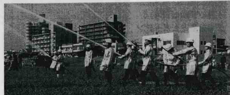
市民消火隊の放水訓練やポンプ操法の発表会もあります。