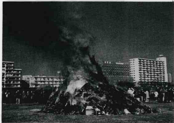
毎年1月7日、六郷橋緑地で行われる六郷のどんど焼き。 主催=六郷の昔を語る会・後援=大田区教育委員会。

発行 わがまち大田 六郷地区推進委員会 編集 「六郷わがまち」編集委員会 事務局 大田区六郷特別出張所 〒144 大田区仲六郷2-42-2 電話 03(3732)4885(代)