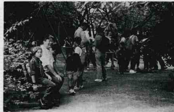
青少対主催のウォークラリー大会は緑地管理事務所前からスタート。