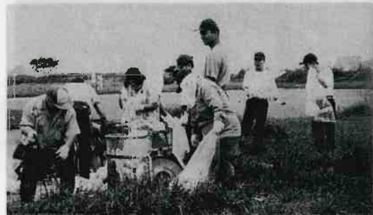
毎週行っている「くすのき園」の清掃活動