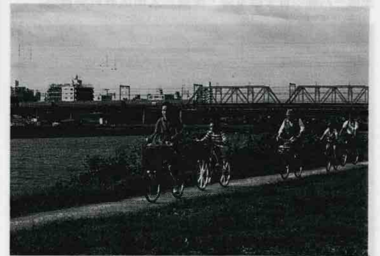
六郷川の堤防ぞいには、大師橋のたもとから丸子橋まで、風を切って快適なサイクリングをする人も多い。川岸にそったサイクリングロードもあります。