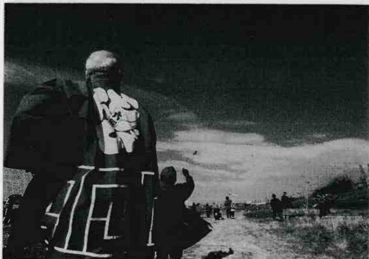
六郷のトンビ凧が空に舞う、新春古川薬師凧あげ大会。 1月15日、西六郷二丁目の河原。主催=古川薬師凧の会。