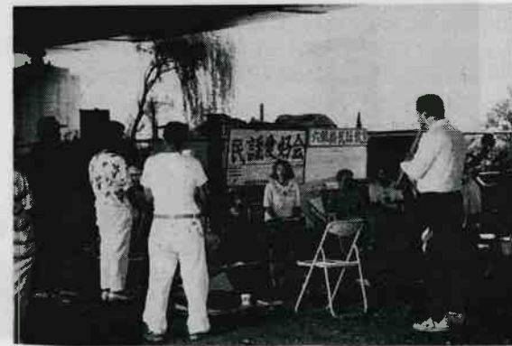
六郷橋下での民謡愛好会の練習(日曜のみ)