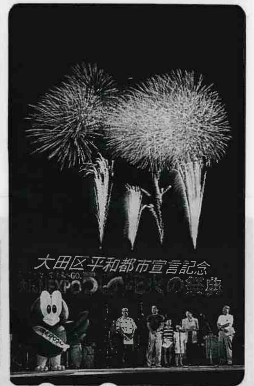
8月15日、大田区平和都市宣言記念、ふれて、つないで、未来へGO! 「大田NEXPO 50・花火の祭典」夜の多摩川緑地で。