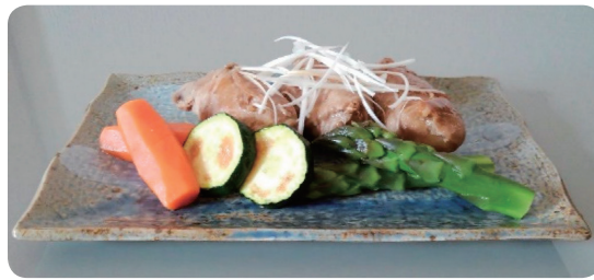
じゃがいもの肉巻き (じゃがいも・豚肉・アスパラ・にんじん・ズッキーニ)