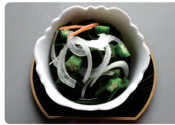
ジャコ入りわかめの酢のもの (わかめ・酢・ジャコ・玉ねぎ・オクラ)