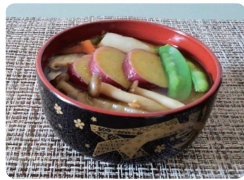
さつまいもの味噌汁 (さつまいも・白菜・キャベツ・しめじ・にんじん)

六郷地区で令和3年11月から5か月間、自治会・町会や民生委員などの地域の方々の協力のもと行った調査では、いも類・海藻類があまり食べられていない食材ということがわかりました。ご存じのように、健康は栄養素をまんべんなく摂ることで保たれています。合言葉は、『 さあにぎやかにいただく 』（2021年大田区発行“フレイル予防ガイドブック”より）今回は、六郷地区に不足している“いも類”と“海藻類”に注目して紹介します！