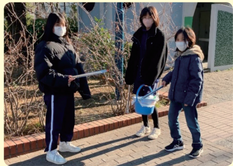
〈南六郷二丁目町会の清掃活動〉 保育園の頃から参加している三姉妹

さあ、いつまでも元気で、自分らしく暮らすためにフレイル予防に挑戦してみませんか。