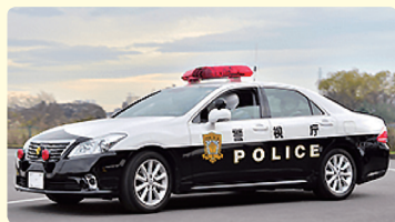
(警視庁ホームページから抜粋)

1950年頃日本で生産される自動車は白色がほとんどでした。パトカーも白一色だったので見分けが付きません。パトカーであることが一目でわかるようにするためにボディ下半分を反対色の黒色塗りにしたのが始まりで1955年には全国的に統一されました。