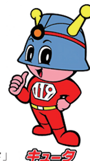
東京消防庁マスコット「キュータ」