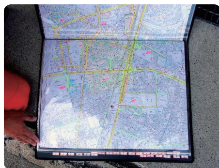
【手作り通行マップ】

はしご車の運転には、大型免許が必要です。車体が長いので走行できる道路が限られるため担当隊員は一刻も早く出動できるように日頃自転車や徒歩で調査、各自の通行マップを作成。「私は4冊目です」と誇りを持って話してくださいました。