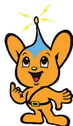
警視庁シンボルマスコット ピーポくん