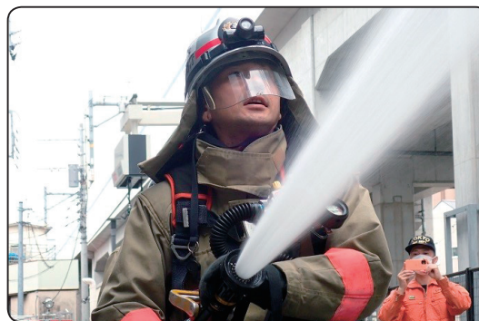
日々訓練を頑張っています!!