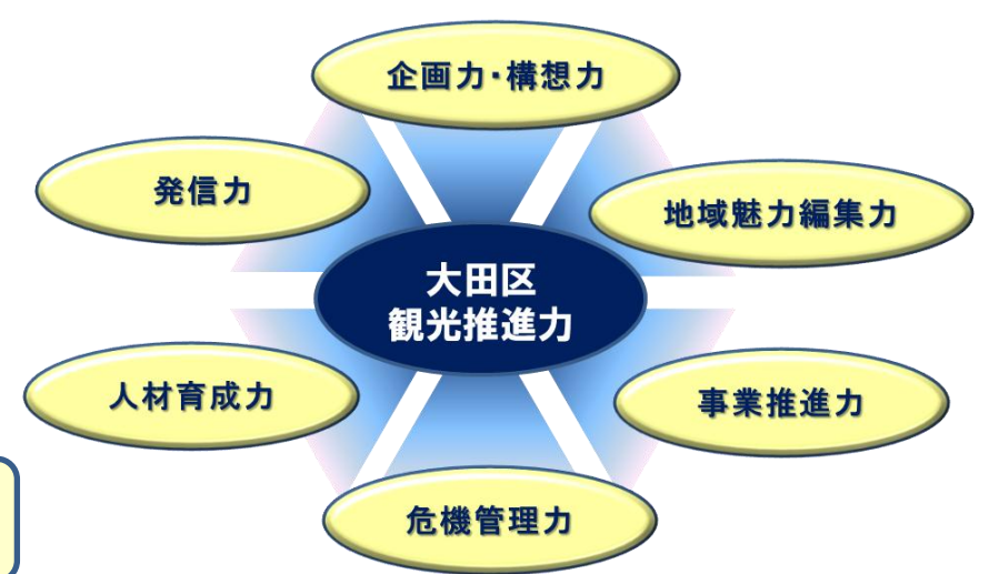
6つの力を結集した大田区観光の推進