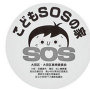
Mẫu nhãn dán Nhà SOS cho trẻ

Ở Nhật Bản, trẻ em học tiểu học thường tự mình đến trường. Do đó, trẻ cần biết trước những địa điểm có thể chạy ngay đến để được giúp đỡ trong trường hợp khẩn cấp. Hãy cho trẻ biết rằng, ngoài đồn cảnh sát, trẻ cũng có thể đến các cửa hàng, nhà dân, cửa hàng tiện lợi, v.v... có nhãn dán “こどもSOSの家 (Nhà SOS cho trẻ – Kodomo SOS Home)” ở gần đó.