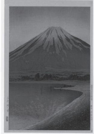
"यामानाकाकोनो आकाचुकी" 1931 साल अगस्टको तस्बिर

हासुइ कावासेले चित्रमा कैद गरेका सुन्दर जापानको दृश्य हेर्न नछुटाउनुहोस्।