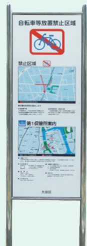
Bảng thông báo