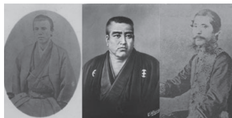
Katsura Kogoro (Kido Takayoshi), Saigo Takamori, Okubo Toshimichi

Sa exhibit na ito, ipapakita namin ang sitwasyon kung saan naging aktibo si Kaishu sa kanyang koneksyon sa mga taong lumampas sa hangganan sa pagitan ng Edo Shogunate at iba't ibang domain, mula sa mga materyales mula noong bandang taong 1864.