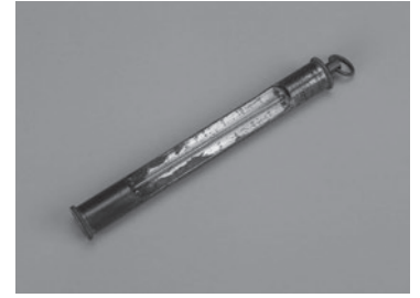
Nhiệt kế của Kaishu được triển lãm ở Văn khố Seimei lúc xưa

Nhà lưu niệm Katsu Kaishu sử dụng hiệu quả Tài sản Văn hóa Hữu hình Cấp Quốc gia “Văn khố Kyu-Seimei”. Văn khố Seimei đã tổ chức chương trình bảo quản di tích và thu thập các đầu sách liên quan đến thời kỳ đầu Showa, và về Kaishu. Triển lãm này tập trung vào các điểm của chương trình “Hội triển lãm” đã tổ chức ở đó để giới thiệu các vật triển lãm đương thời.