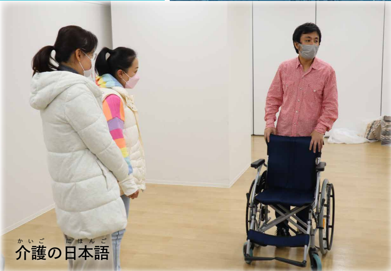
かいご にほんご 介護の日本語