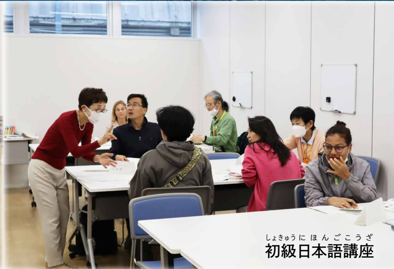
しょきゅうにほんごこうざ 初級日本語講座