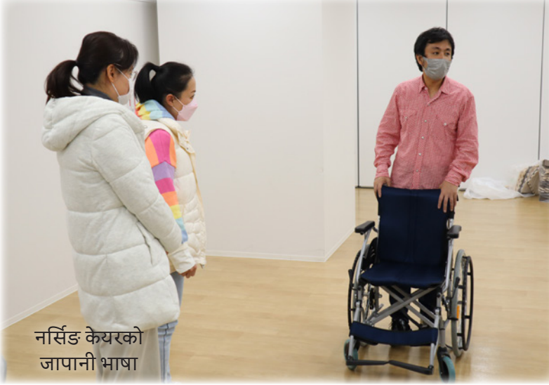
नर्सिङ केयरको जापानी भाषा