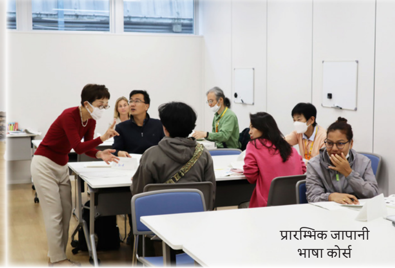
प्रारम्भिक जापानी भाषा कोर्स