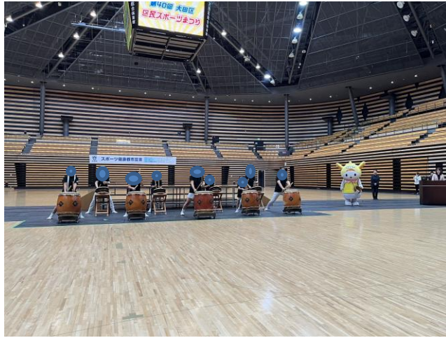
第40回大田区区民スポーツまつり、子供達の和太鼓演奏