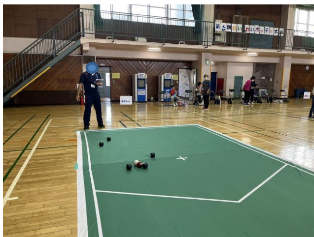
わいわいポッチャ大会