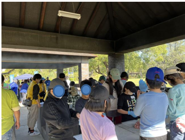
入新井地区デイキャンプ、子供達はカレーを作っている