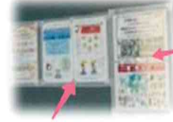
掲示物の他に 自社のPRも してくださって います