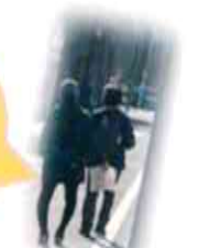
ご高齢の方も 「あっちなあ？」