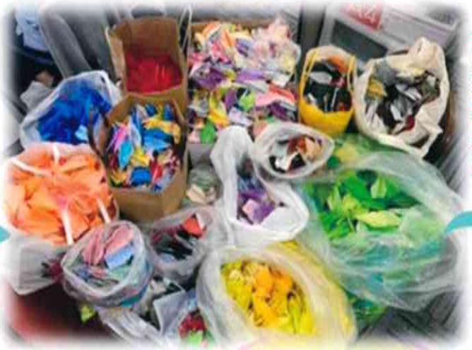
8.9月、 2万羽飛んで来た!