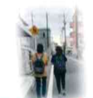
若い方も地図片手に