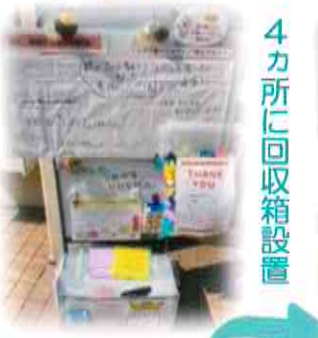
4カ所に回収箱設置