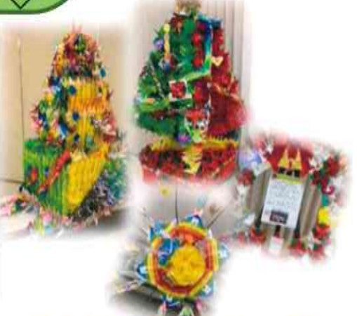
愛や絆をテーマに虹のかかる空・神輿・Xmas ツリー・リース・民生委員さん作の傘