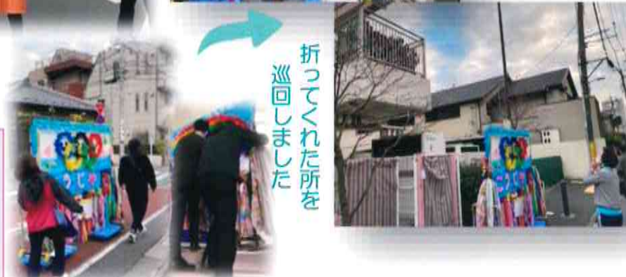
折ってくれた所を 巡回しました