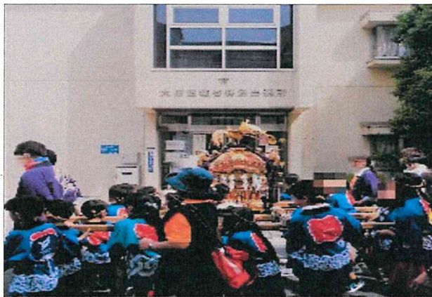
にぎやかな子ども神輿！！