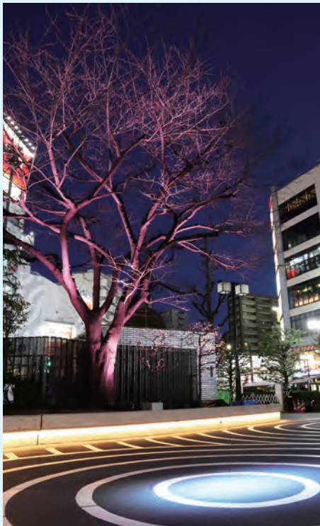
▲季節により変わる夜景演出が広場を幻想的な空間に

3月31日に大森駅東口駅前広場がリニューアルオープン。段差が解消され誰でも使いやすく生まれ変わった広場には、縄文土器の文様を模した特徴的な舗装デザインが施されています。夜間には、広場のシンボルである桜をライトアップする演出も行われるようになり、大森駅東口の新しい顔になること間違いなし！