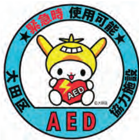
▲このステッカーが目印です