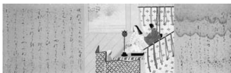
《竹取物語》(部分)1934(昭和9)年頃

●会期 4月25日(土)~7月5日(日)午前9時~午後4時30分 ●ギャラリートークと庭園案内 ☎5月2・23日、6月27日(土) ※いずれも午後1時から