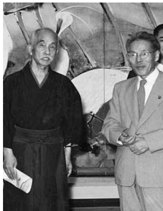
昭和27年 青龍展に訪れた川合玉堂(左)と龍子(右)

日本画家・川端龍子の交友関係を解説します。 日 1月23日(土)午後2時～3時30分 会 大田文化の森 抽選で150名 問合先へ往復はがきかFAX(記入例参照)。1月9日必着 ※1通につき2名まで申し込み可 園 龍子記念館 (〒143-0024中央4-2-1「第2回記念館講座」係) ☎FAX 3772-0680