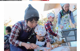
▲アウトドアクッキング