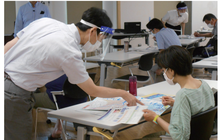
マイ・タイムライン講習会の様子