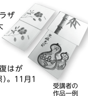
受講者の作品一例