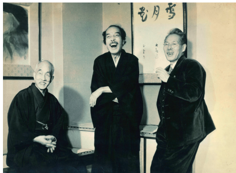
第2回雪月花展における川合玉堂、大観、龍子の三巨匠(昭和28(1953)年)