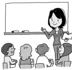
申し込みはコチラ

期 区内在住・在勤・在学の16歳以上で、日本語の勉強をしたことがない方や平仮名・片仮名・簡単な日本語会話が難しい方 期 5月15・22・29日、6月5・12・19・26日、7月3・10・24日(月)午前10時～正午 会 Minto Ota 費 1,500円 定 抽選で20名 申 問合先へEメール(記入例参照)か、申込書(問合先で配布)をFAX。問合先HPからも申し込み可。5月8日締め切り 会 (一財)国際都市おおた協会 ☎ 6410-7981 FAX 6410-7982 E mail@ota-goca.or.jp