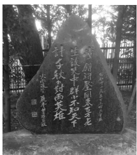
徳富蘇峰が洗足池に建立した両英雄詩碑

期 5月14日(日) ①午前10時～正午②午後2時～4時 会 山王草堂記念館(集合)、勝海舟記念館(解散) 費 300円(65歳以上の方は240円) 定 抽選で各10名 申 問合先へ往復はがき(記入例参照。希