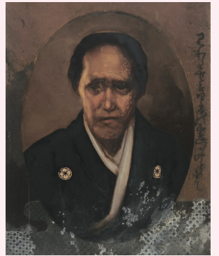
海舟の母の肖像画(修復前)