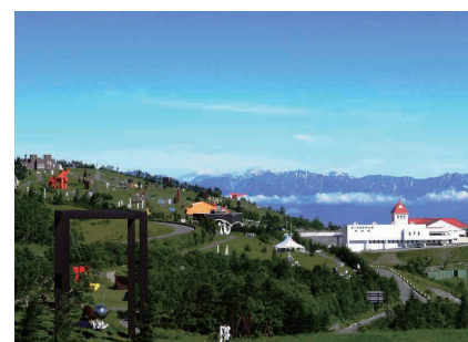
▲美ヶ原高原美術館 全景

▶ 問合せ先 地域力推進課区民施設担当 ☎5744-1229 FAX5744-1518