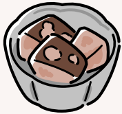
かぼちゃの煮物 1食分90g 食物繊維3.5g