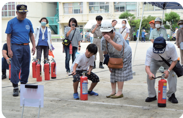
初期消火訓練の様子

地区合同防災訓練を、消防署の指導のもと実施し、地域全体で防災に関する意識を高めました。