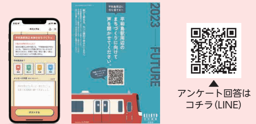
アンケート回答は コチラ(LINE)

区と京浜急行電鉄株は、鉄道沿線を中心とした地域活性化のための取り組みを連携して行っています。現在、平和島駅周辺でのまちづくりを進めており、その参考とするため、駅周辺に関わる方々がスマートフォンなどから気軽に参加できるデジタルアンケートを実施しています。アンケートを活用し、沿線の皆さまに住んで良かったと思ってもらえるまちづくりを進めていきます。