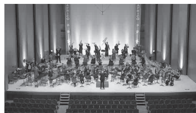
令和4年度開催の様子