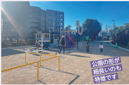
公園の形が細長いのも特徴です