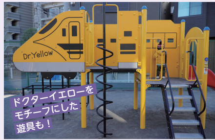
ドクターイエローをモチーフにした遊具も!

拡張リニューアルし、さらに遊具が充実しました。蒲田操車場に面した立地で、公園がかつて鉄道用地であったこともあり、園内には電車や踏切をモチーフにした遊具がたくさん設置されています。公園に遊びに来ていた親子は「こどもが鉄道マニアなので大興奮です!」とお話してくれました。