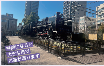
時間になると大きな音で汽笛が鳴ります