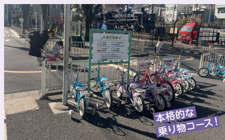
本格的な乗り物コース!