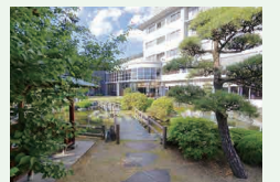
▲シャトレゼホテル石和