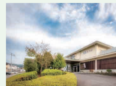
▲伊豆長岡温泉京急ホテル

利用日の3か月～3日前までに各施設へ電話予約。チェックイン時に宿泊者全員の本人確認を行います。区内在住の方は身分証明書、在勤の方は身分証明書のほかに在勤証明が必要です。