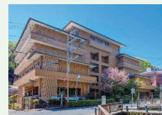
▲フォレストリゾート ゆがわら水の香里