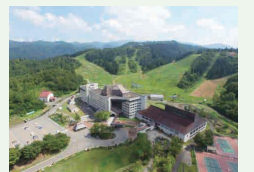
▲ニュー・グリーンピア津南