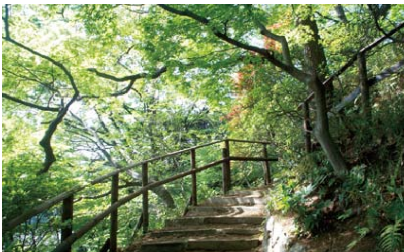
田園調布せせらぎ公園