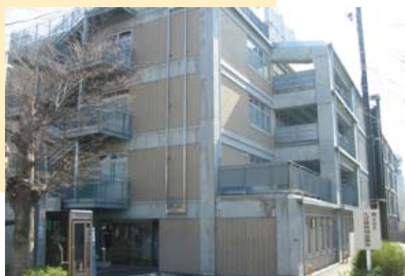
久原小学校と併設されている久が原特別出張所