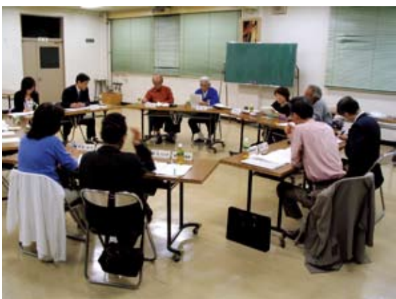
地域情報紙の編集会議