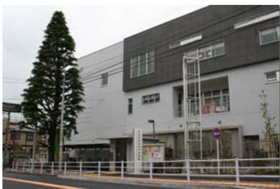
平成20年2月に業務を開始した 雪谷保育園と併設されている雪谷特別出張所