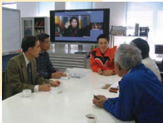
地域の方が主体となって行った関係機関への取材