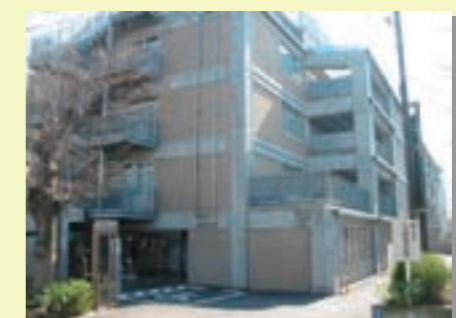
久原小学校と併設されている久が原特別出張所