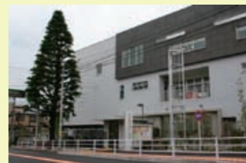
雪谷保育園と併設されている雪谷特別出張所