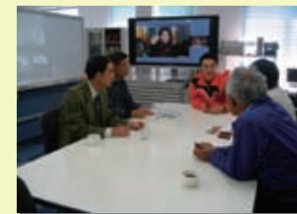
地域の方が主体となって行った関係機関への取材