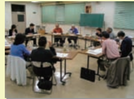
地域情報紙の編集会議